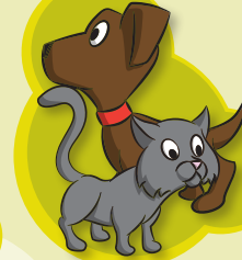
HUND- & KATZENFELL