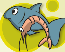
FISCH & MEERESFRÜCHTE